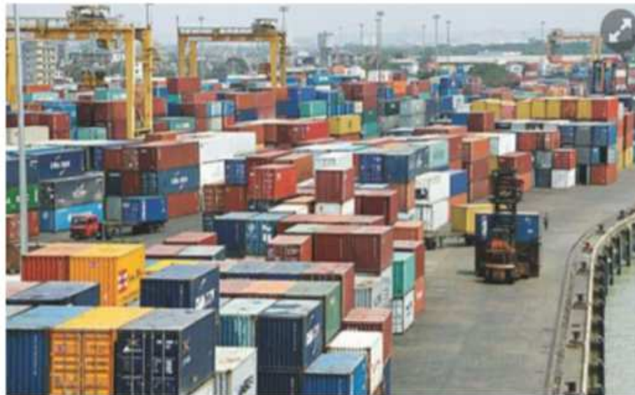
Chattogram sea port.

Chattogram sea port has been ranked the 64th busiest among the top 100 container ports across the world.