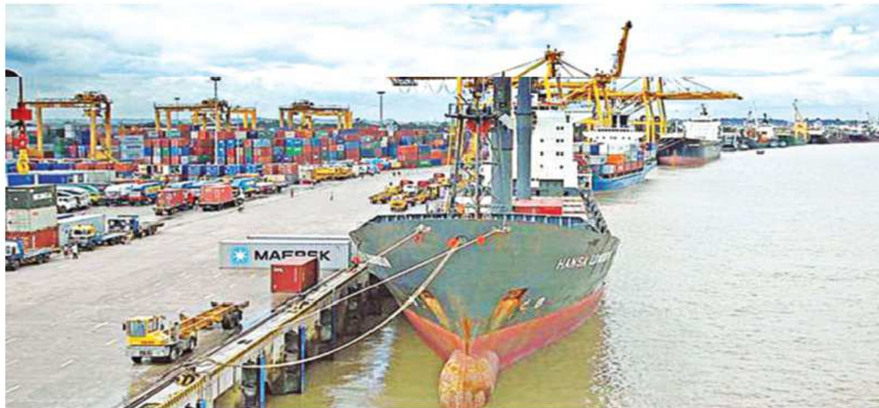
Chittagong Port, the country's main seaport, has advanced six notches in container-handling in the 2019 edition of Lloyd's List.